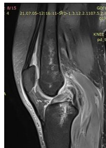
МРТ снимки до операции.