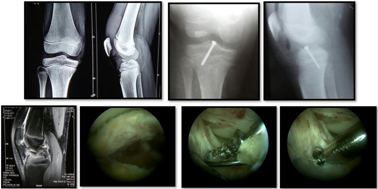
Остеосинтез межмыщелкового возвышения под артроскопическим наблюдением